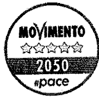
“Movimento 5 stelle”