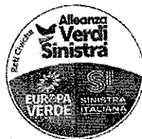
“Alleanza Verdi sinistra”