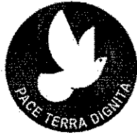
“Pace Terra Dignità”